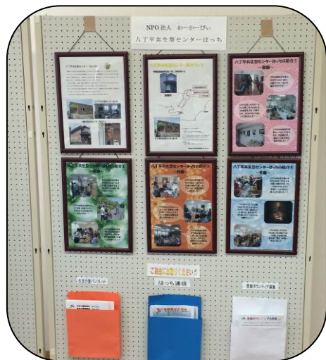
展示してるパネルです♪

先日、秋晴れのいい天気の日にダンパラまで紅葉を見に行ってきました。残念ながら紅葉は見られませんが、景色を楽しんでこれました♪