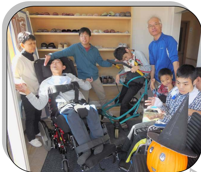
Trick or Treat♪