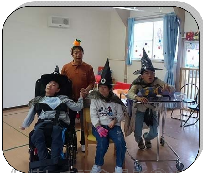
仮装して記念撮影②♪